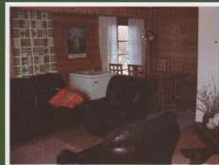
Kuva mökin olohuoneesta

HALUATKO YÖPYÄ RAATTEESSA - TAI TULLA PIDEMMÄKSI AJAKSI