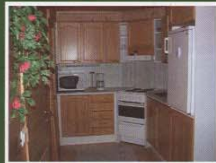
Kuva mökin keittiöstä